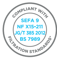
完全遵循国内外行业标准