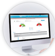
eGuard智能联网,实时在线监控管理