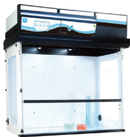
外部尺寸(mm)(长*宽*高) 483 1298x751x1333/1515