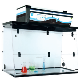
外部尺寸(mm)(长*宽*高) 481 1284x615x1107/1289