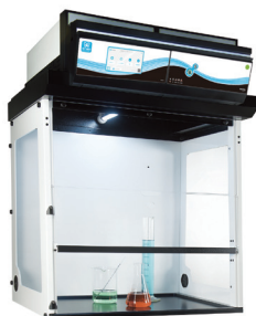
外部尺寸(mm)(长*宽*高) 392 1006x751x1333/1515