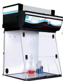
外部尺寸(mm)(长*宽*高) S 321 804x556x969/1151 321 804x615x1107/1289