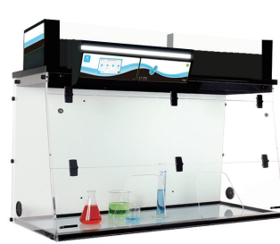
外部尺寸(mm)(长*宽*高) 632 1606x615x1107/1289