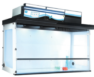
外部尺寸(mm)(长*宽*高) 633 1620x751x1333/1515