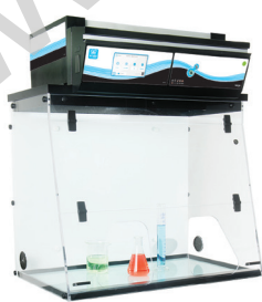
外部尺寸(mm)(长*宽*高) 391 1009x615x1107/1289