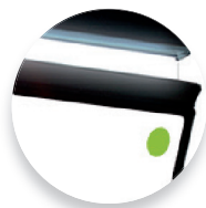
通过光环闪烁传递信息