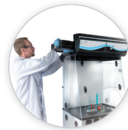
完善的售后服务体系