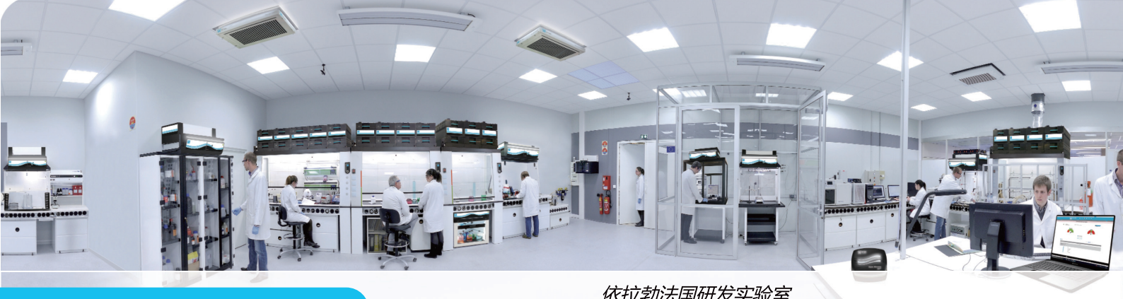
依拉勃法国研发实验室