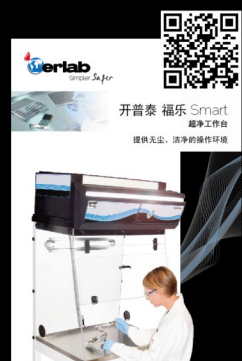
Captair Flow 開普泰 福樂 超淨工作台