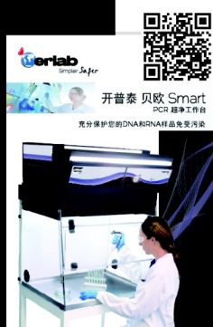
Captair Bio 開普泰 貝歐 PCR 超淨工作台