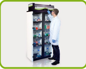
落地式 净气型储药柜