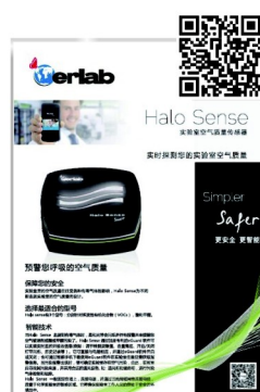
實驗室空氣質量傳感器