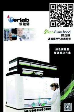
绿飞翹 高效能淨氣型通風櫃