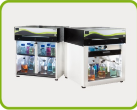
桌下型 净气型储药柜

注: TWA值为中华人民共和国国家职业卫生标准(GBZ2.1-2007), 意为每天8小时工作场所允许的化学品接触限值。