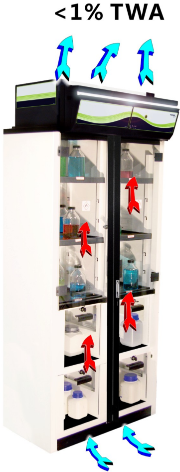
开普泰 Smart 无管净气型储药柜