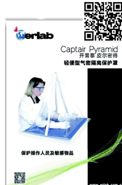
Captair Pyramid 開普泰 皮爾密得 輕便型氣密隔離保護罩