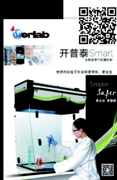
Smart 通風櫃 適用於日常化學品操作