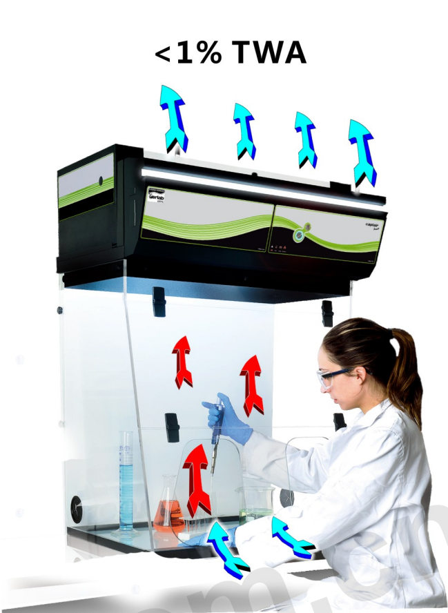
开普泰 Smart 无管净气型通风柜