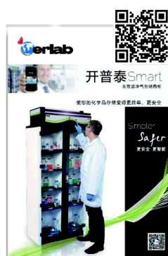
開普泰 Smart 無管道淨氣型儲藥櫃