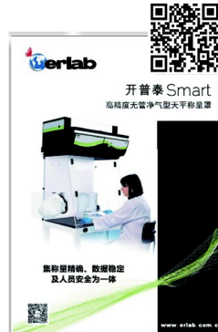
開普泰 Smart 無管道淨氣型天平稱量罩