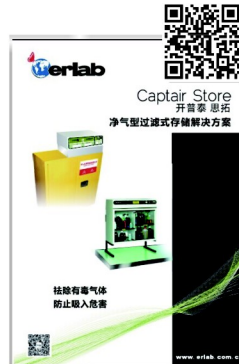
Captair Store 開普泰 思拓 淨氣型過濾式存儲解決方案