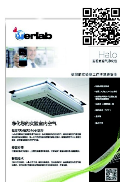
實驗室空氣淨化儀